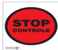
Stop, bemande controle