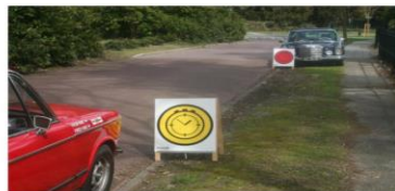
Bemande tijdcontrole, opstelling