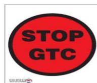
Stop, geheime tijdcontrole