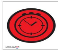
Tijdcontrole registratie passeertijd