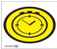
Bemande tijdcontrole bij passeren wordt tijd geklokt